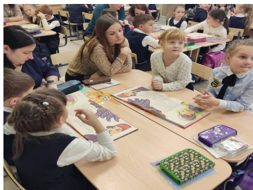
Организация работы в группах

Научная новизна исследования определяется введением нового типа урока, как формы взаимодействия школы и семьи.