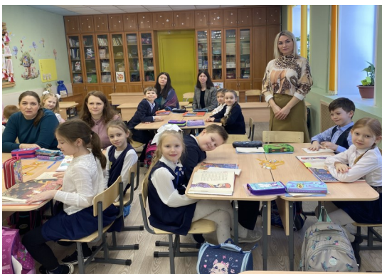
Работа в «семьях—группах»