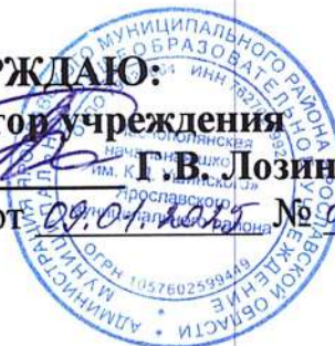
ГРАФИК питания обучающихся в столовой на 2024-2025 учебный год (II полугодие) (вторник, среда, пятница) 1-4-е классы