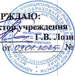
ГРАФИК питания обучающихся в столовой на 2024-2025 учебный год (II полугодие) (понедельник, четверг) 1-4- классы